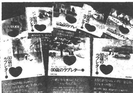
これまでに出版された60歳のラブレター(全50冊)の表紙(左から)

中高年の男女を対象に、伴侶への感謝の気持ちをしたためた一枚のはがきを募集する「60歳のラブレター」が根強い人気だ。2009年で第9回。受賞作などは毎年、本にまとめて出版され、販売総部数は42万を超える。5月には受賞作品を原案にした映画も公開される。